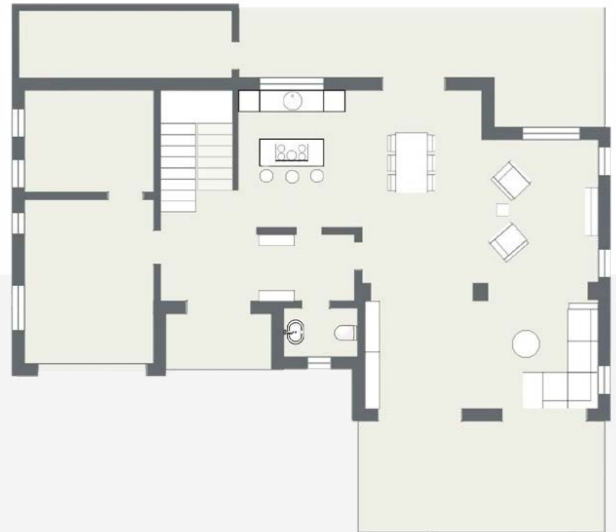
Erdgeschoss | ground floor

Geplant sind eine Fußbodenheizung, eine Klimaanlage, ein Grill- und Barbereich neben dem Pool, eine Weinkammer unter der Treppe sowie Anschlüsse für einen Jacuzzi auf dem Balkon neben dem Masterbedroom.