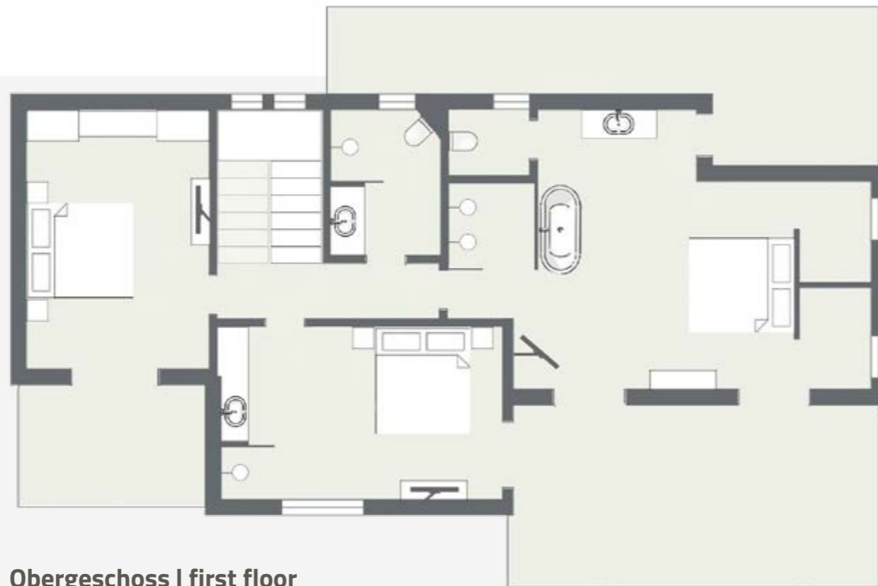
Obergeschoss | first floor