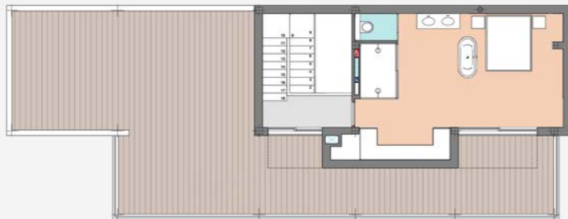
Obergeschoss | first floor