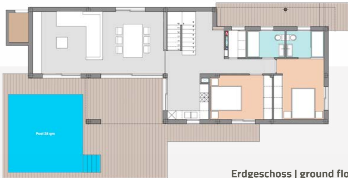
Erdgeschoss | ground floor